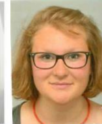
Pflege Station B5