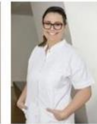
Pflege Station B2